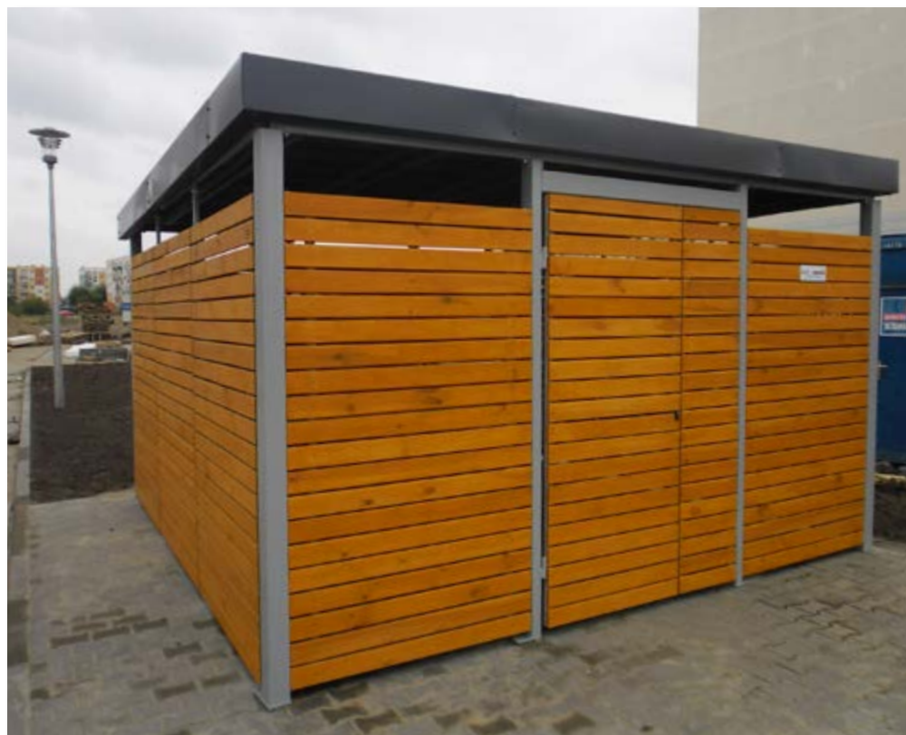
Altany w elewacji drewnianej