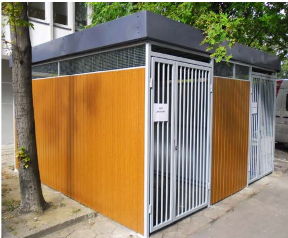
Altany z blachy